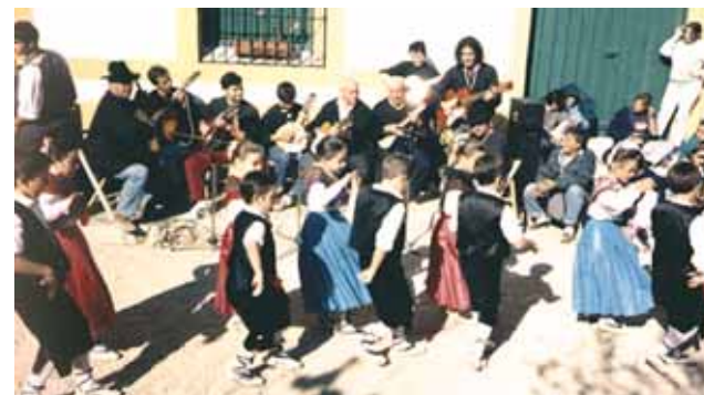
Festa in onore del Prodigio chiamata la «Pedredia», a memoria del luogo dove fu ritrovata l'Ostia