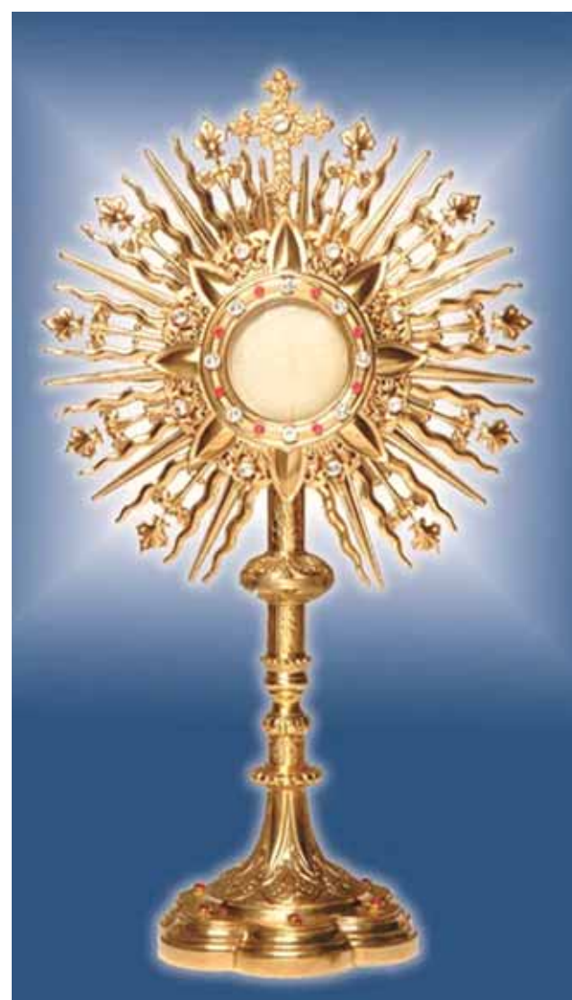
Reliquia dell'Ostia che si conserva intatta