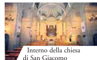
Interno della chiesa di San Giacomo