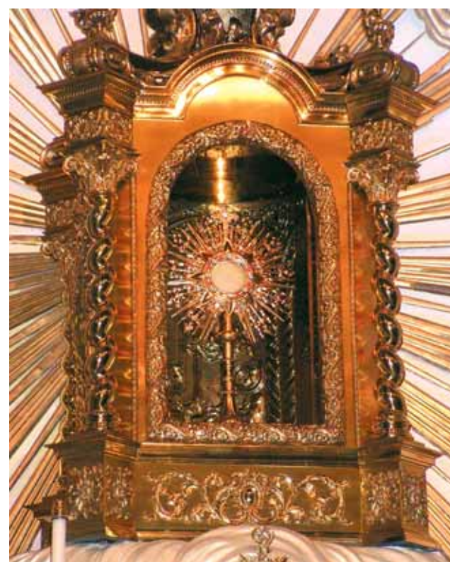
Reliquia dell'Ostia Miracolosa

Ancora oggi si può ammirare nella chiesa parrocchiale di San Giacomo Apostolo di Onil, l'Ostia miracolosa che è rimasta intatta dopo quasi due secoli. Ogni anno si celebra la Festa di Nostro Signore «Robat», per commemorare il Prodigio Eucaristico e il ritrovamento dell'Ostia.