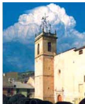
Chiesa di San Giacomo Apostolo ad Onil, dove si conserva l'Ostia miracolosa