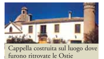
Cappella costruita sul luogo dove furono ritrovate le Ostie