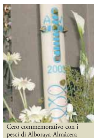
Cero commemorativo con i pesci di Alboraya-Almácer