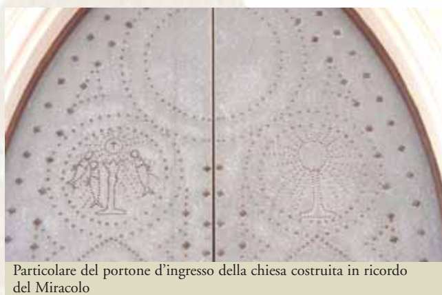
Particolare del portone d'ingresso della chiesa costruita in ricordo del Miracolo