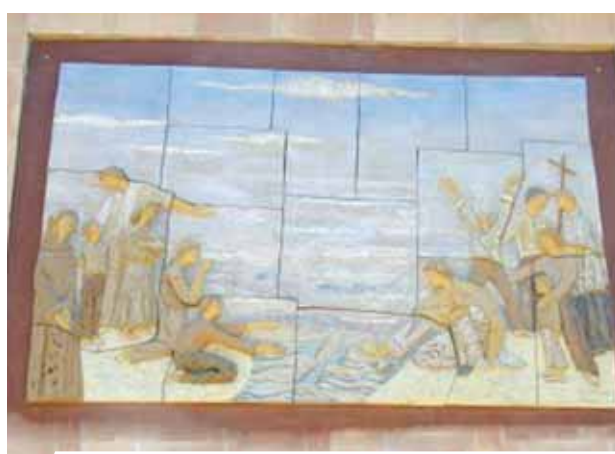
Mosaico esterno alla chiesa