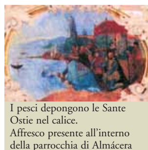
I pesci depongono le Sante Ostie nel calice. Affresco presente all'interno della parrocchia di Almácer