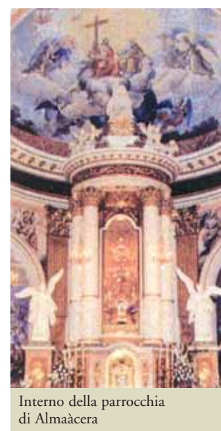
Interno della parrocchia di Almácer