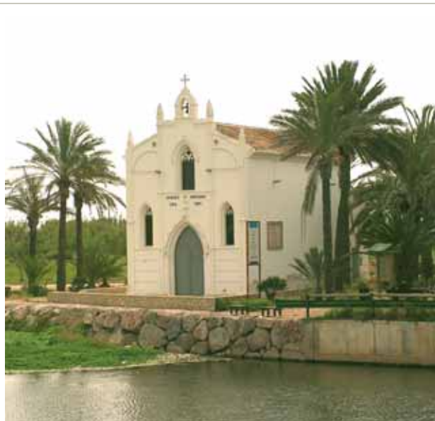
Chiesa Ermita di Alboraya