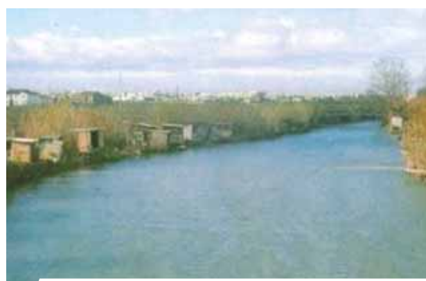
Affluente della Sierra Calderona, attraversato dal Sacerdote