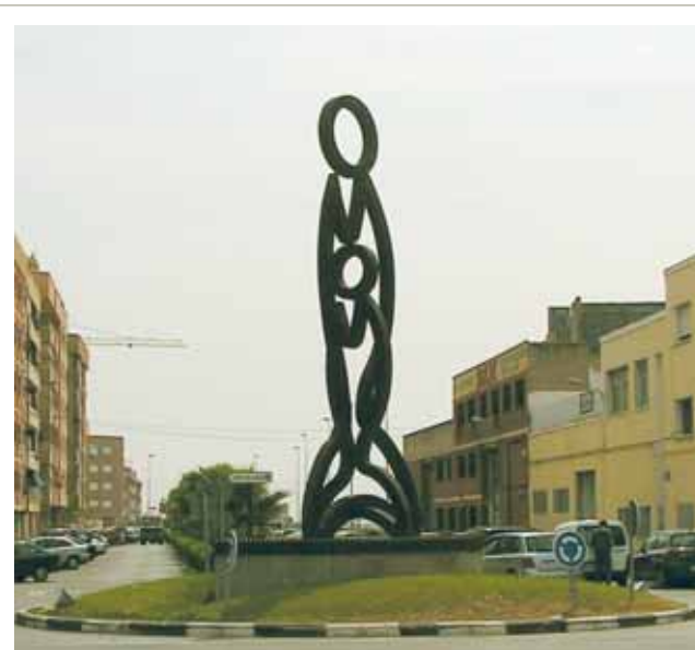
Scultura commemorativa del Miracolo in centro città