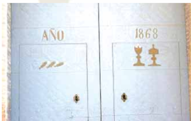
I pesci del Miracolo sono raffigurati nella porta d'ingresso della chiesa