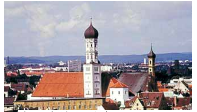
Convento di Heilig Kreuz, Augsbug