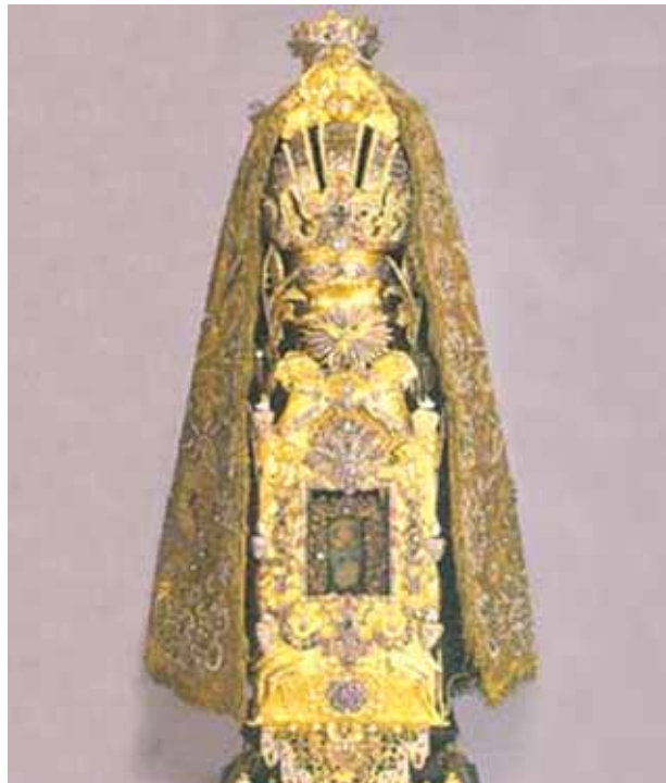
Reliquiario contenente l'Ostia del Prodigio conosciuta con il nome di Wunderbarlichen Gutes

Il Miracolo Eucaristico di Augsbug, conosciuto dai locali con il nome di « Wunderbarlichen Gutes-Bene Miracoloso », è descritto in numerosi libri e documenti storici consultabili presso la biblioteca statale e civica di Augsbug. Un'Ostia rubata si trasformò in carne sanguinante. Nel corso dei secoli furono compiute diverse analisi sulla Particola che hanno sempre confermato che si tratta di carne e sangue umano. Oggi il Convento di Heilig Kreuz è custodito dai Padri Domenicani.