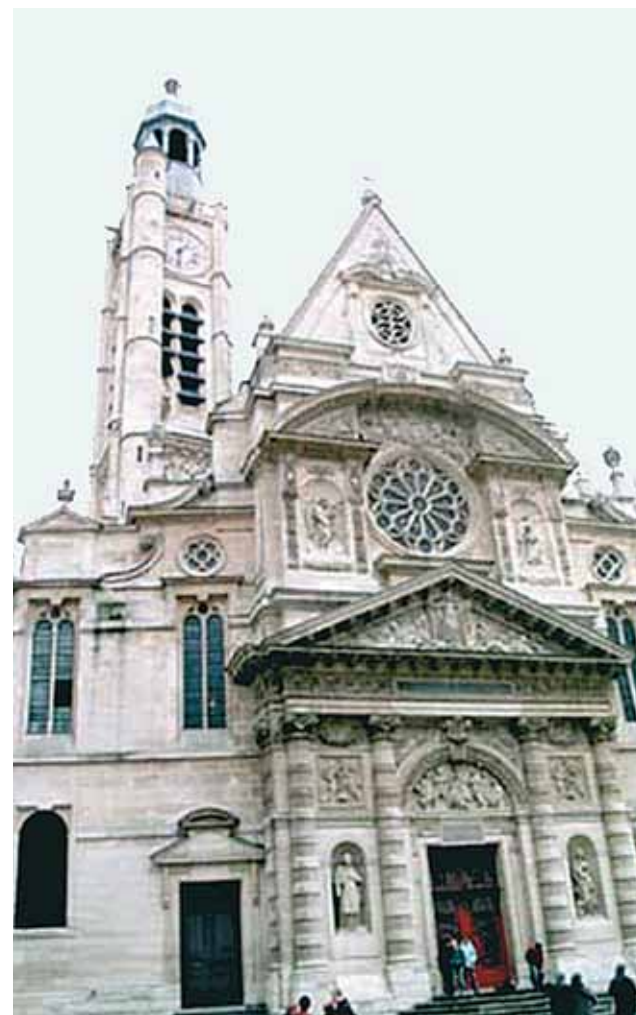
Chiesa di Saint Etienne du mont

Esistono numerosi documenti che testimoniano tutti gli avvenimenti di questo Miracolo, anche lo storico italiano Giovanni Villani nella sua celebre Storia di Firenze , nel VII libro, al capitolo 136 riporta brevemente tutti gli aspetti principali del Miracolo. Un'indagine molto approfondita su tutte le fonti è stata fatta dalla Sig.ra Moreau-Rendu, nella sua opera intitolata: A Parigi, via dei Giardini edito nel 1954, con prefazione di Mons. Touzé, che fu Vescovo ausiliare di Parigi. L'autrice, dopo una minuziosa indagine sui documenti, sottoposti a un rigoroso esame, si pronunciò con sicurezza a favore dell'autenticità dei fatti. Ma la narrazione più conosciuta è la «Storia della Chiesa di Parigi» scritta dall'Arcivescovo francese, Mons. Rupp, che parla del Miracolo Eucaristico di Parigi nelle pagine dedicate all'Episcopato di Simon Matifas