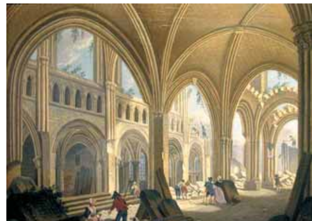
Demolizione della chiesa Saint-Jean-en-Grève. Pierre-Antoine Demachy (1797)