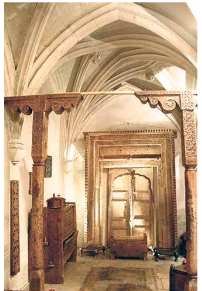
Interno del Chiostrò della chiesa des Billetes