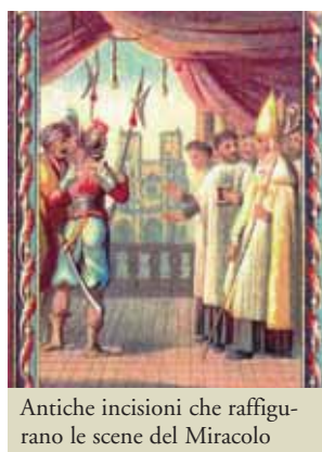
Antiche incisioni che raffigurano le scene del Miracolo