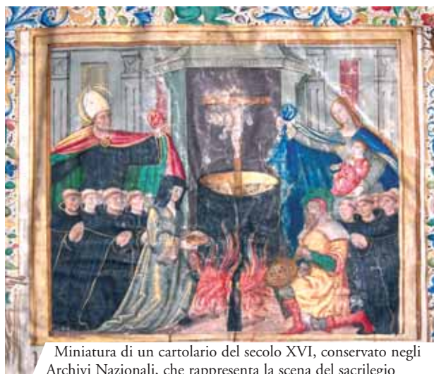
Miniatura di un cartolario del secolo XVI, conservato negli Archivi Nazionali, che rappresenta la scena del sacrilegio