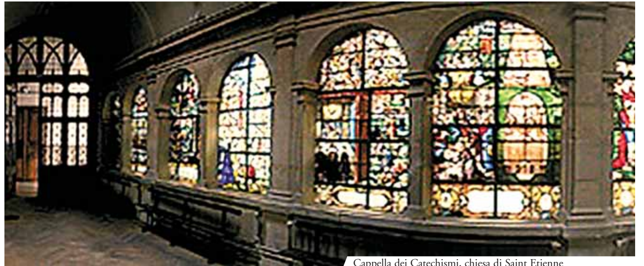
Cappella dei Catechismi, chiesa di Saint Etienne

Disperato allora la gettò nell'acqua bollente e questa, improvvisamente, si librò in aria, prendendo l'aspetto di un crocifisso.