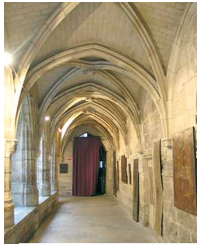
Chiostrò des Billetes, divenuta oggi chiesa protestante