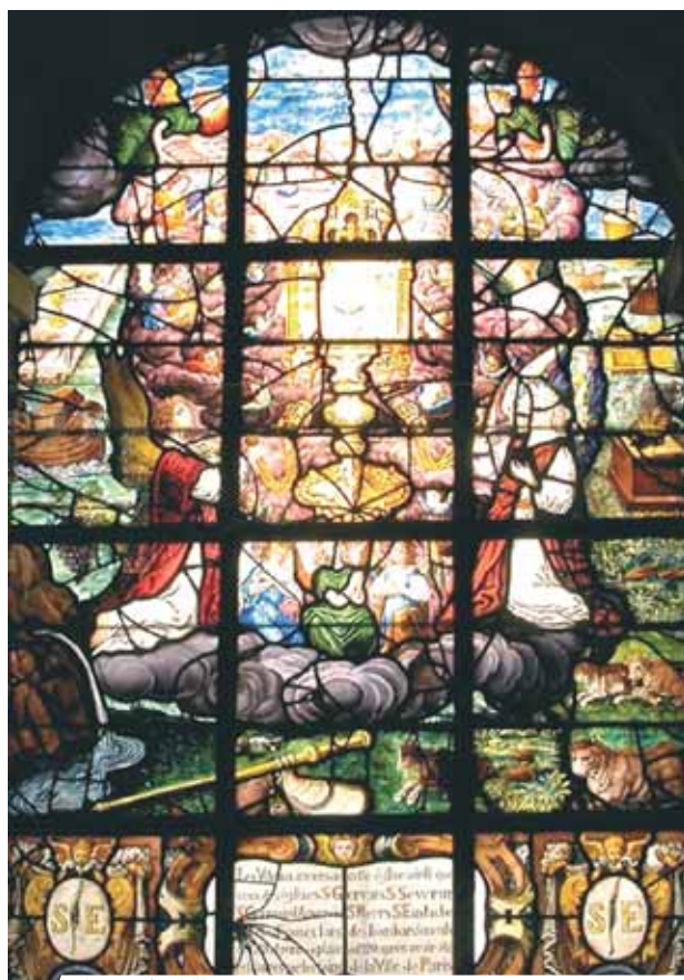
Il trionfo dell'Eucarsitia