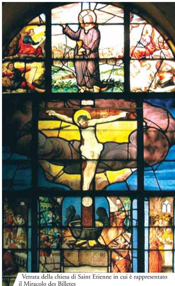
Vetrata della chiesa di Saint Etienne in cui è rappresentato il Miracolo des Billetes

Durante la Pasqua del 1290 un non credente, che aveva in odio la Fede Cattolica e non credeva alla presenza reale di Cristo nell'Eucaristia, riuscì a procurarsi un'Ostia consacrata per profanala: la prese a coltellate e la gettò nell'acqua bollente. L'Ostia si sollevò da sola davanti all'uomo, che rimase sconvolto, poi andò a posarsi nella ciotola di una pia donna che subito consegnò la Particola al proprio parroco. Le autorità ecclesiastiche, il popolo e anche il re decisero di trasformare la casa del profanatore in una cappella in cui conservare la santa Ostia, che verrà distrutta durante la rivoluzione.